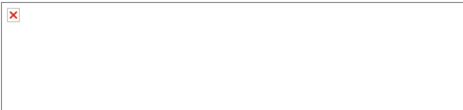
Figura 1: Estructura general del método Prim@

Las figuras 1 a 3 muestran, de una manera gráfica, la estructura de este método: