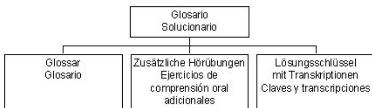
Figura 3: Estructura del "Glosario y Solucionario" de Prim@