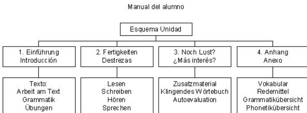
Figura 2: Estructura de cada Unidad de Prim@ del manual del alumno