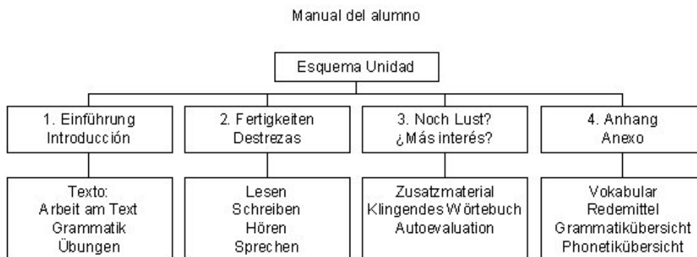
Figura 2: Estructura de cada Unidad de Prim@ del manual del alumno