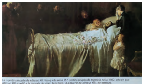
Imagen 40. Álvarez Osés et alt. , 3.º BUP (Santillana, 1994), 241. Presenta La muerte de Alfonso XII de Juan Antonio Benlliure, sin hacer reflexionar a los alumnos sobre su función propagandística.

Pero, por razones obvias, la práctica de despojar al rey su traje metafísico para recuperar su cuerpo visible, es más frecuente con los monarcas españoles, especialmente en el caso de los reyes de la Restauración y de Juan Carlos I: