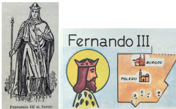
Imagen 31. Edelvives, 2.º Bach. (1949), 188 y Álvarez, Enciclopedia 1.º Grado (1964), 200. Las imágenes de los reyes, hasta los años 70 del pasado siglo inspiradas en la pintura historicista, grabados, medallones y esculturas, no guardan ni pueden guardar contacto alguno con su cuerpo visible. Sólo reflejan las cualidades que lo trascienden: sanctitas (nimbo), imperium (espada), potestas (corona, manto, vara), la auctoritas , gravitas y serenitas que dan a entender la nobleza, altos ideales religiosos y patrióticos.

Entre las virtudes que trascienden el cuerpo físico de Fernando III, está la santidad . La Historia General de Juan de Mariana, el Compendio de Duchesne-Isla y la historiografía más reaccionaria recuerdan su dedicación a la guerra santa de la Reconquista, la construcción de catedrales, su muerte ejemplar: «puestos los hinojos en tierra —dice el Padre Mariana— con un dogal al cuello y la cruz delante, como reo pecador, pidió perdón de sus pecados a Dios con palabras de grande humildad». 556