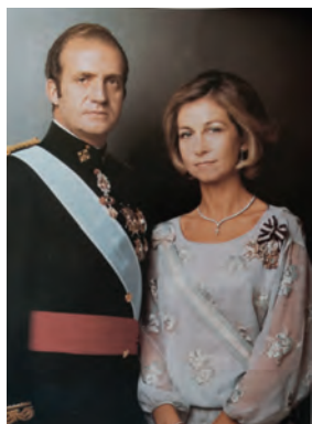
Imagen 38. Tusell, 2.º Bach. (Santillana, 1996), 398. El retrato oficial de los reyes Juan Carlos y Sofía se acomoda a un sistema democrático, da una imagen más cercana. Conserva los atributos metafísicos más relacionados con la auctoritas (bandas, toisón), pero reduce los símbolos que representan la potestas (bastón de mando) y el imperium propios del Rey-Soldado: persisten el uniforme, el fajín y los galones de Capitán General, pero desaparece el sable, el león. Los manuales, que usan este retrato como elemento decorativo, no dan pie a ningún comentario, a ninguna descodificación.

En la medida en que se reduce lo metafísico, se recupera el cuerpo físico del rey. Ocurre con monarcas extranjeros, como el zar Nicolás II: