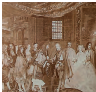
Imagen 36. Balanzá et al. 3.º BUP (Vicens Vives, 1987), 185. Indica a los alumnos: «Observa abajo el tapiz de Gobelinos (cartón de Lebrun), que representa la entrevista realizada en la isla de los Faisanes (Bidasoa) entre un viejo y cansado Felipe IV y un jovencísimo y emperifollado Luis XIV, para firmar la paz». La juventud y vejez del cuerpo de los reyes se convierte en representación de sus respectivas naciones.

Los retratos que presentan los manuales muchas veces trascienden la física: