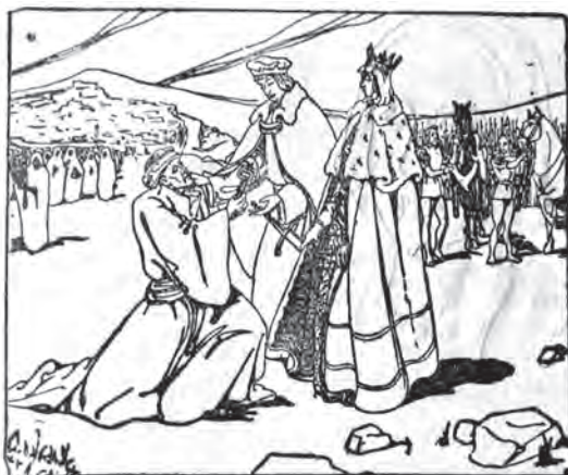
Imagen 33. Serrano de Haro, España es así (1960), 141. La escena de la entrega de las llaves de Granada sirve para ensalzar la fuerza y, a la vez, la magnificencia y liberalidad de los reyes con el vencido.

Si la tradición liberal se identificaba con la causa comunera, durante el franquismo, los manuales de FEN se identifican con la idea imperial de Carlos V y en el resto se impone la interpretación nacionalcatólica y monárquica: Carlos V fue capaz de corregir su error (colocar al frente de Castilla gobernantes flamencos codiciosos) y de poner su espada al servicio de Dios y de su Iglesia. Desde los años 60 (valores tecnócratas, aggiornamento vaticano, nueva historiografía crítica con el imperialismo de los Austrias y su gestión económica), parece recuperarse la tradición liberal. 565 Pero ello no significa la desaparición de una actitud reverencial ante la figura del rey.