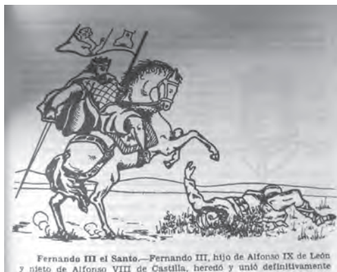
Imagen 32. Álvarez, Enciclopedia (1971), 733. Al menos durante el franquismo no hay contradicción entre la faceta de santo y la de violento guerrero conquistador de Fernando III.

Aunque no fue declarado santo por la Iglesia, también tiene mucho eco la muerte ejemplar de Fernando I, según Duchesne-Isla, reflejo y «eco de su vida». F.T.D. expresa mejor que nadie la dicotomía entre los dos cuerpos del rey Fernando I: a la hora de su muerte se desnuda, pide a Dios que le arranque el alma de su cuerpo mortal, y «devuelve» a Dios el poder recibido (la Realeza o segunda naturaleza). 558