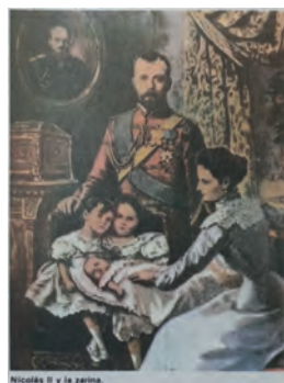
Imagen 39. Grup LLavors, COU (1987), 329. Los retratos que presentan los manuales pueden supeditar el cuerpo metafísico al cuerpo físico del rey (escena familiar, cotidiana), pero sin invitar a descodificar su finalidad propagandística originaria.

En la medida en que se reduce lo metafísico, se recupera el cuerpo físico del rey. Ocurre con monarcas extranjeros, como el zar Nicolás II: