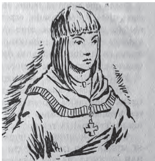
Imagen 30. Serrano de Haro, España es así (1960), 159. La idealización del rostro femenino llega al paroxismo en la representación de Isabel la Católica.

Durante el franquismo, libros de lecturas como Guirnaldas de la Historia de Agustín Serrano de Haro se redactan con la misión específica de exaltar modelos de feminidad como Berenguela, Isabel de Portugal, Eugenia de Montijo, Catalina de Aragón, en contraste con ciertas mujeres que «haciendo política o discutiendo ideas», contribuyeron a la «triste decadencia» del siglo XVIII. En su España es así ensalza a María de Molina, «reina, dulce y buena, enérgica y prudente, tratando a unos con cariño, con entereza a otros, buscando apoyo en el pueblo y sacrificando su tranquilidad y sus riquezas, salvó la vida y la corona de su hijo», Fernando IV. 546 Las imágenes de los manuales sirven para reforzar estas virtudes: