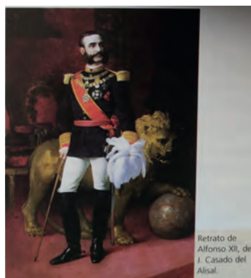
Imagen 37. Maroto, 2.º Bach. (Almadraba, 2003), 337. Retrato de Alfonso XII de J. Casado de Alisal. El retrato, usado como ilustración y no como documento, no da pie para descodificar sus ingredientes ideológicos: la fortitudo y el imperium (león, sable, uniforme militar), potestas (trono, bastón de mando), la auctoritas , dignitas y serenitas que traducen la pose o los símbolos como el Toisón de Oro. El cuerpo metafísico del Rey, por tanto, queda incólume.

Los retratos que presentan los manuales muchas veces trascienden la física: