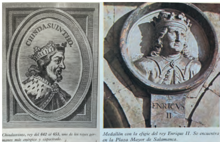
Imagen 34. Lobo et al. , 3.º BUP (Bruño, 1977), 76 y 109. Grabado que incluye el Compendio cronológico de la Historia de España de José Ortiz Sanz (edición de 1841) y medallón de la Plaza Mayor de Salamanca, que sirvieron de inspiración para los grabados de los manuales del pasado. Pero el autor sigue sin aclarar la intención propagandística con que fueron concebidos.

A la metafísica que rodea a la Realeza contribuyen también las ilustraciones que inundan los manuales. Desde los años 70 del siglo xx el grabado abstracto e idealizado es sustituido, por ejemplo, en el manual de Bruño (3.º BUP), por sus fuentes de inspiración (grabados de obras historiográficas decimonónicas, medallones de la Plaza Mayor de Salamanca, del Hospital de San Marcos de León), aunque sin contextualizar, sin evidenciar la intención con que fueron creados: