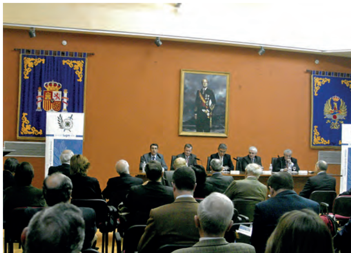
Mesa redonda «Universidad y defensa» (14 de febrero de 2006).