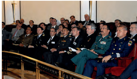
Asistentes a la presentación de la Comunidad Iberoamericana de Investigación sobre Paz, Seguridad y Defensa en el Paraninfo del CESEDEN (19 de octubre de 2006).