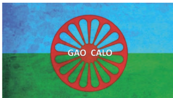
Imagen 2. Logo GAO CALÓ

El proyecto surge desde la Asociación GAO CALO (Pueblo Gitano). Es una entidad que se crea en el año 2010, desde la propia sociedad gitana de Talavera de la Reina (Toledo), en respuesta a multitud de situaciones familiares e individuales que llevan a la precariedad o a la exclusión social de este colectivo.