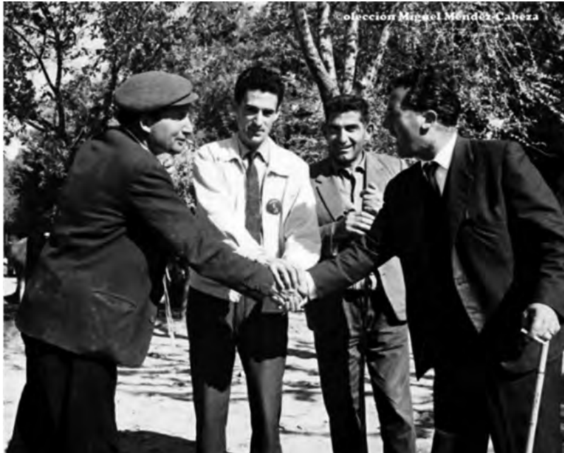
Imagen 1. Un trato en el Mercado de ganados de Talavera