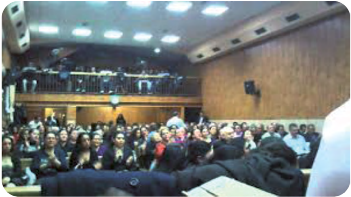
Imagen 3. Culto Evangélico

de se encuentra también ubicado el centro evangélico de dicho barrio («El Culto»), con una capacidad para aproximadamente 500 personas.