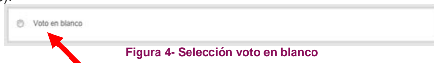
Figura 4- Selección voto en blanco

Para seleccionar su opción deberá pulsar en el checkbox (círculo a la izquierda de las opciones).