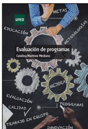
Evaluación de programas