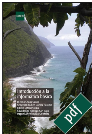
Introducción a la informática básica