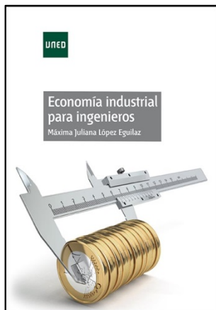
Economía industrial para ingenieros