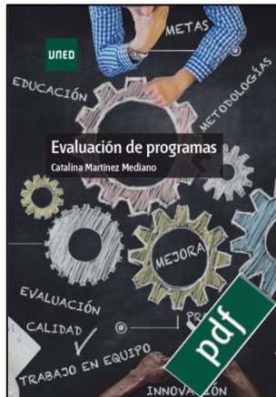
Evaluación de programas