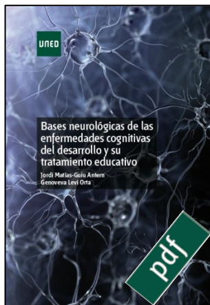
Bases neurológicas de las enfermedades cognitivas del desarrollo y su tratamiento educativo