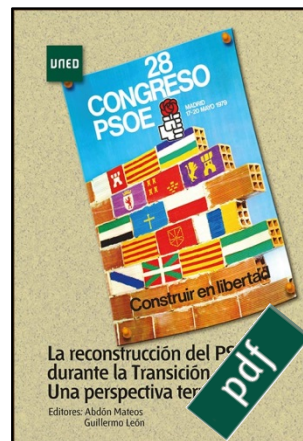
La reconstrucción del PSOE durante la transición. Una perspectiva territorial