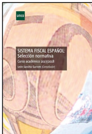
Sistema fiscal español: selección normativa curso académico 2017/2018