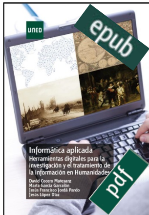
Informática aplicada. Herramientas digitales para la investigación y el tratamiento de la información en humanidades