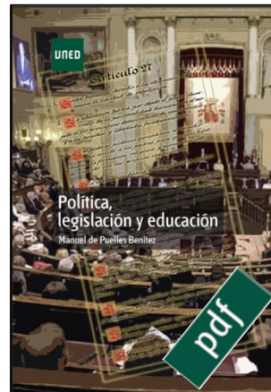
Política, legislación y educación