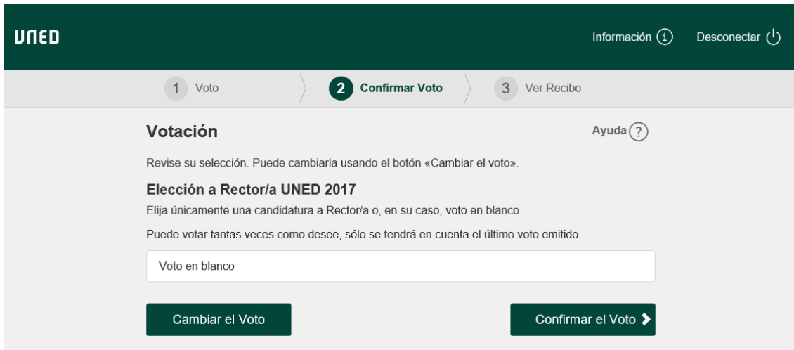
Figura 3. Pantalla Confirmar Voto.

Si pulsa “Cambiar el Voto” el sistema le mostrará la página de votación de nuevo (ver Figura 1) con todas las opciones de voto para que cambie su opción si lo desea. En caso de pulsar “Confirmar el Voto” el sistema le mostrará el recibo de voto de la elección.