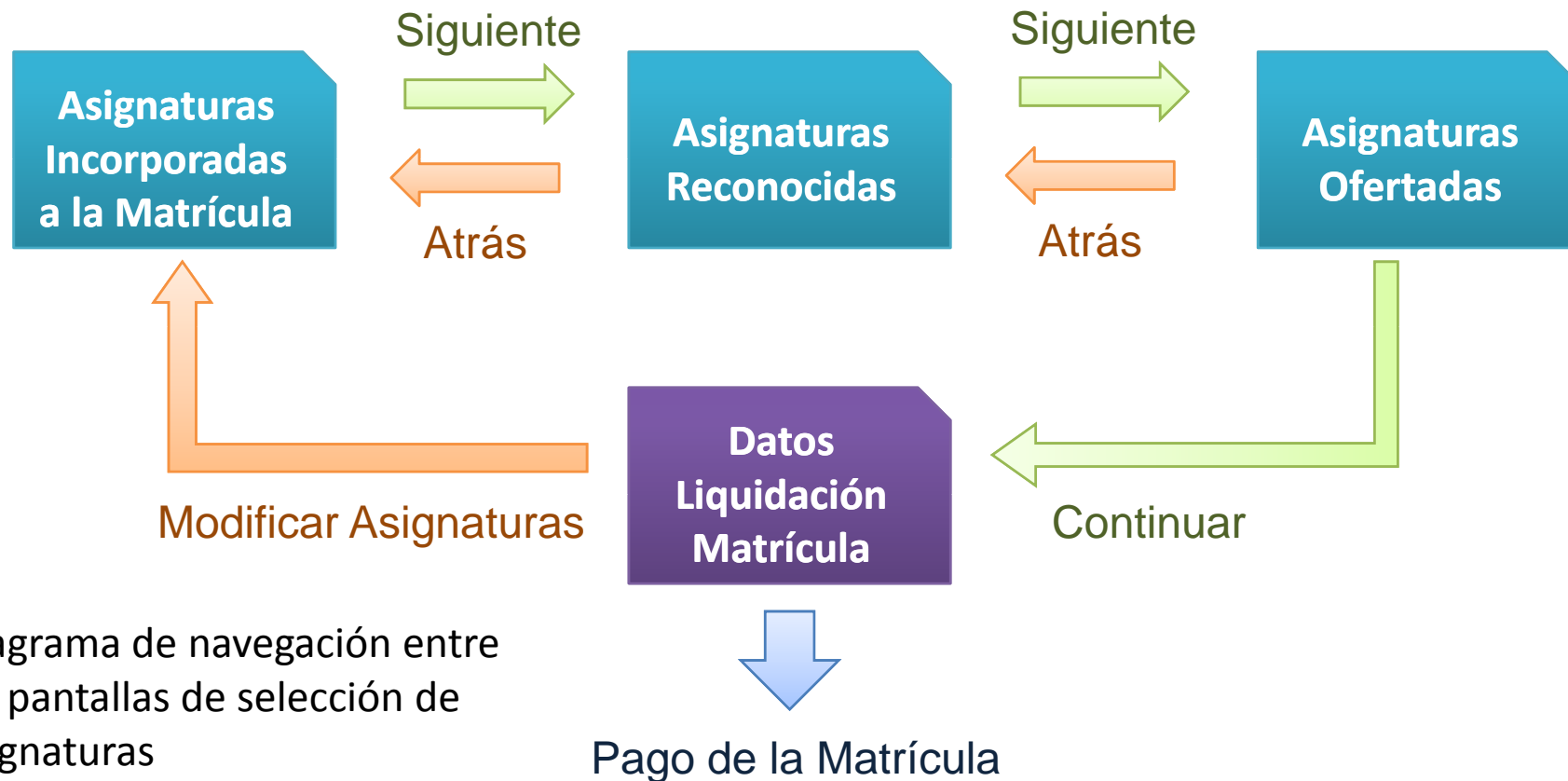
Diagrama de navegación entre las pantallas de selección de asignaturas