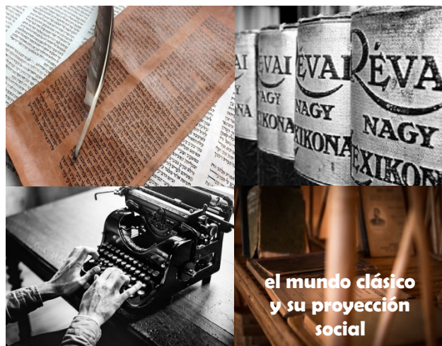
el mundo clásico y su proyección social

Pruebas presenciales. / Trabajos / Actividades de aprendizaje programadas /