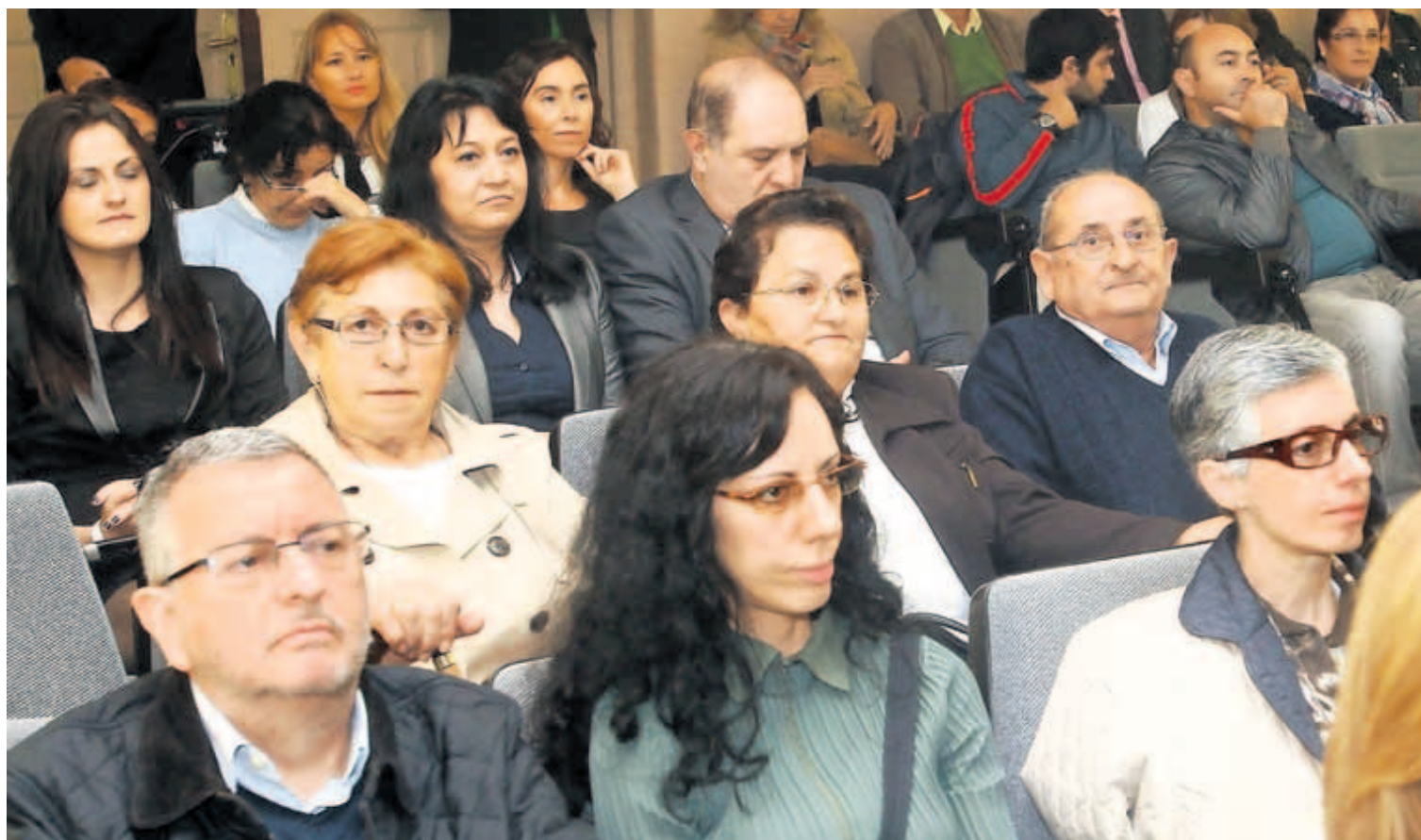
Público asistente a la lección inaugural del curso de la UNED, ayer en el salón de plenos de la Diputación.